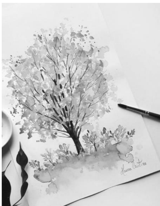
Ipê Rosa